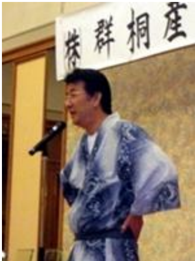
株式会社群桐産業 濱屋社長による挨拶