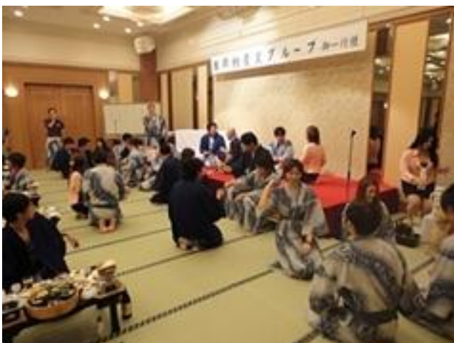
宴会では白熱のジャンケン大会が開かれました。優勝者はなんと、永年勤続 20 年の社員でした。ダブル受賞おめでとうございます！