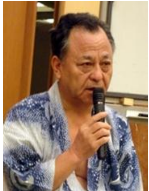
群桐産業グループ 山口会長による挨拶