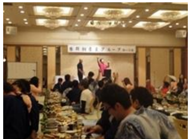
カラオケも始まり大盛り上がり！！