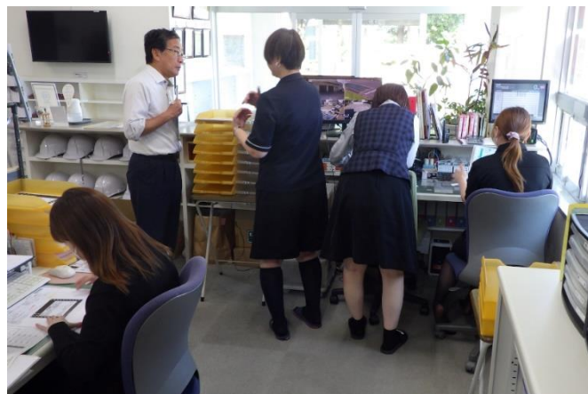
群桐エコロ(株) 総務審査（事務所）