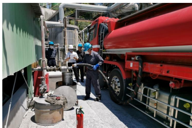
(株)群桐産業 作業立会審査（再生重油配送）