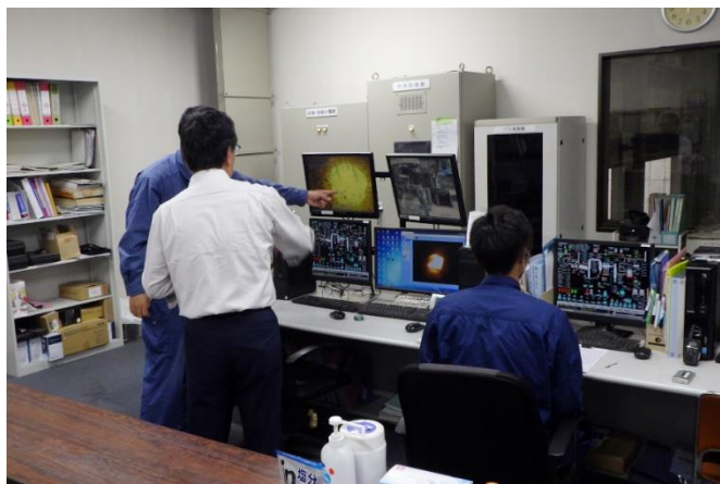
群桐エコロ(株) サイトツアー（新田工場）