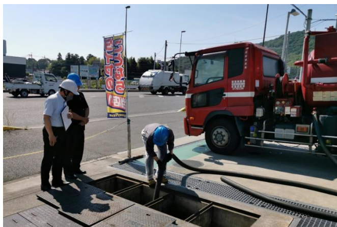
(株)群桐産業 作業立会審査（分離槽清掃）