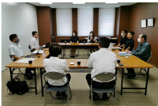
オープニングミーティング

不適合は0件、肯定的観察事項が3件、改善の機会が3件という内容で問題無く終了いたしました。