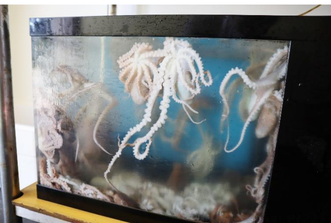
生ダコもあります