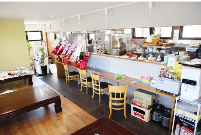
落ち着いた雰囲気の内