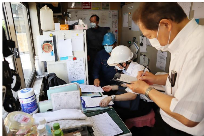
(株)群桐産業 書類審査（藪塚工場）