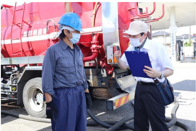
(株)群桐産業 インタビュー（分離槽清掃）