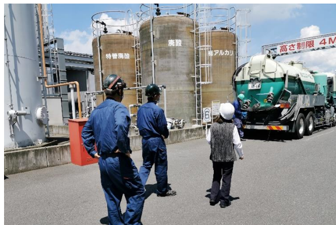
群桐エコロ(株) サイトツアー（新田工場）