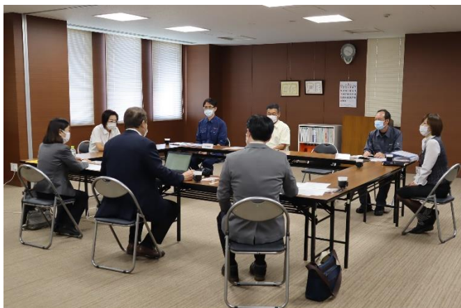
オープニングミーティング

不適合は0件、肯定的観察事項が1件、改善の機会が11件という内容で問題無く終了いたしました。