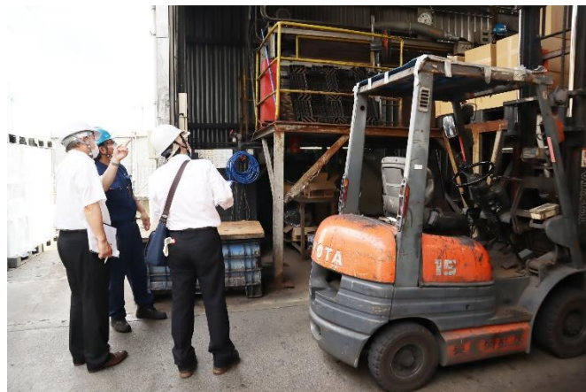
(株)群桐産業 焼却炉審査（藪塚工場）