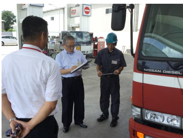
(株)群桐産業 作業立会い審査（廃油回収②）