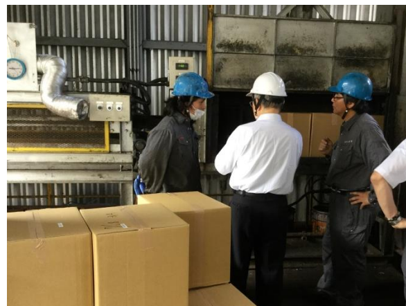
(株)群桐産業 審査（焼却プラント①）