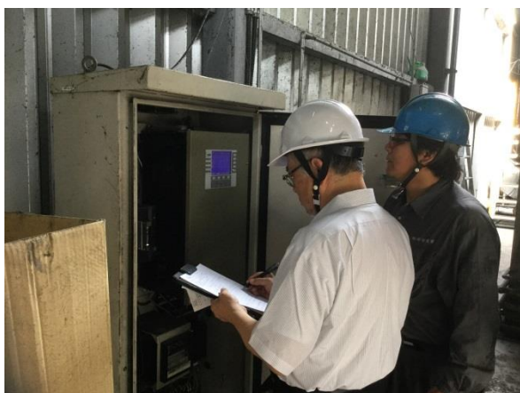
(株)群桐産業 審査（焼却プラント②）